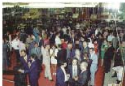
The prizegiving celebration offers an excellent opportunity for establishing new commercial and professional contacts.