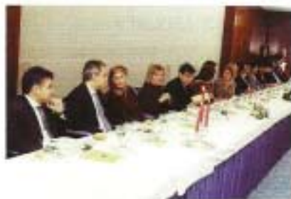
Commercial authorities and diplomatic corp presiding the award presentation.