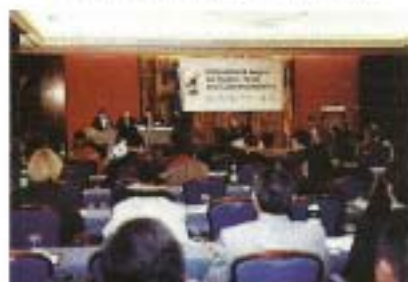
Work meeting and presentation of the awarded companies.