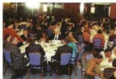
Handing over of the 34th International Award for Tourist, Hotel and Catering Industry.